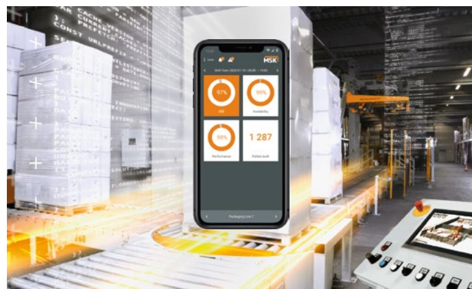
Az MSK EMSY smart APP a digitális EMSY termékpallettánk része

A vevőinknél tapasztalt, mindinkább fokozódó szakemberhiány miatt az MSK új, digitális termékeket fejlesztett, mint például az MSK berendezések mobil státusz-felügyeletét segítő MSK EMSY smart APP. Jelenleg az MSK csapat a vevőknél szerviz-technikus helyszíni bevetését nem igénylő műszaki támogatást, többek között karbantartásokat, hibafeltárásokat, gépbeállításokat, stb., lehetővé tévő MSK service pad fejlesztésén dolgozik. A termék 2021. elején kerül ki a piacra.